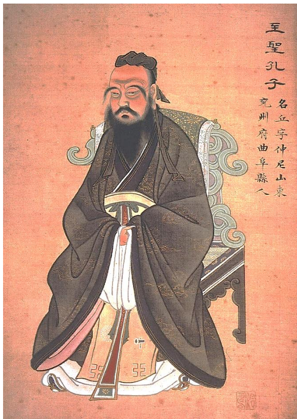
Konfucius 551-479 př. n. l. první čínský filozof