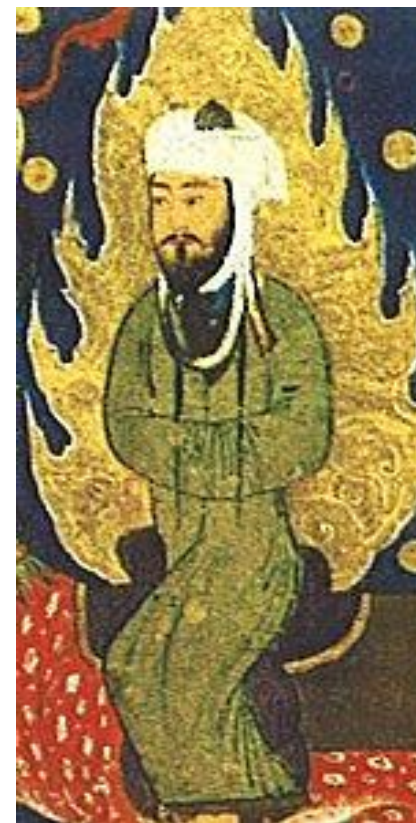
Mohamed 571-632 n. l. poslední prorok pro lidstvo zakladatel islámu