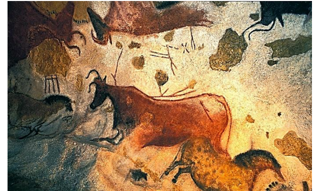
Lascaux (JZ Francie) 15 – 13 000 př. n. l. mladší paleolit