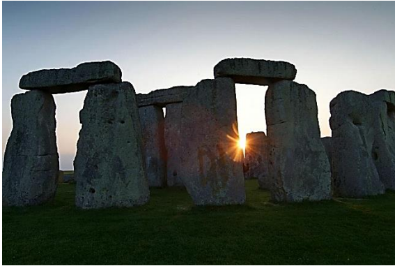
Stonehenge 2100 a 1900 př. n. l.