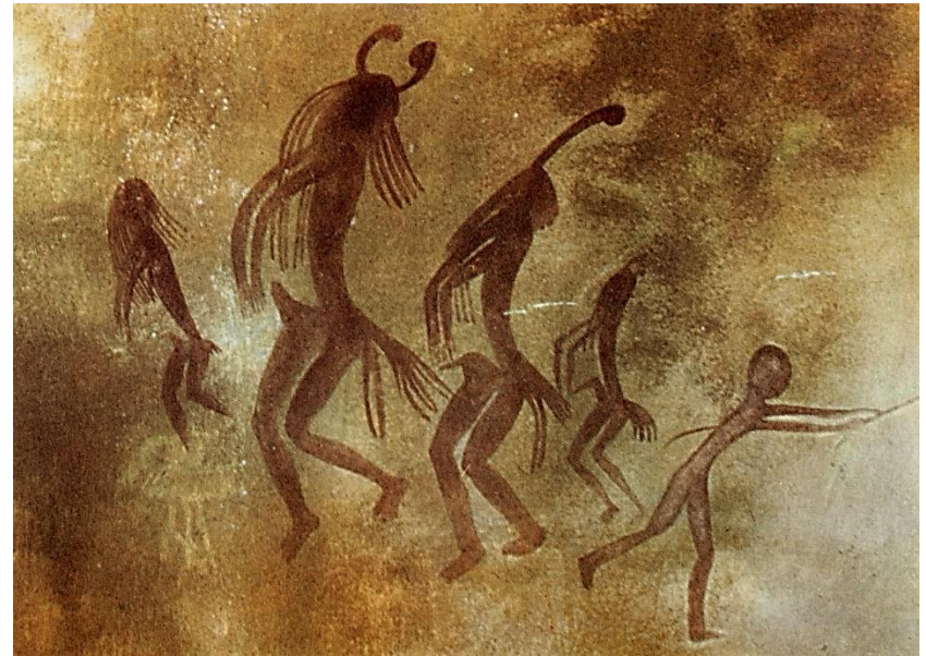
rituální tanec – pravěk nástěnná malba – S Afrika