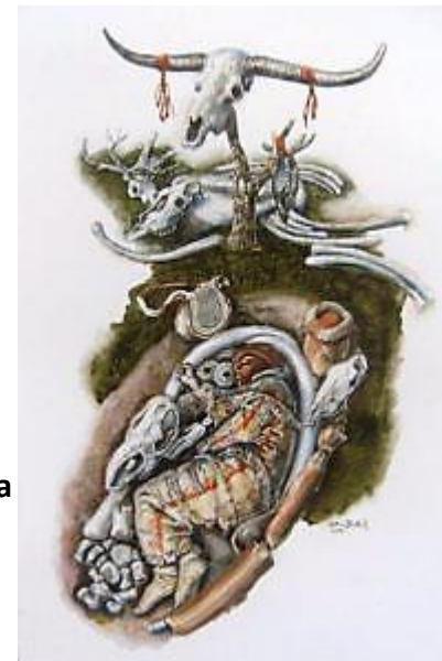
Hrob šamana z Brna